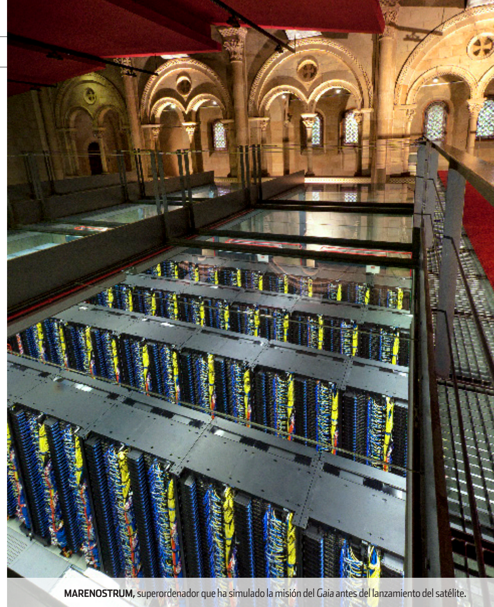
MARENOSTRUM, superordenador que ha simulado la misión del Gaia antes del lanzamiento del satélite.

La primera misión espacial dedicada en exclusiva a la obtención de datos astrométricos se lanzó en 1989. Hipparcos , de la ESA, cartografió durante cinco años 120.000 estrellas con una precisión inaudita del orden del milisegundo de arco. La información recogida, la más completa hasta la fecha, ayudó a predecir los impactos del cometa Shoemaker-Levy 9 sobre Júpiter, reveló que la Vía Láctea está cambiando de forma y confirmó la