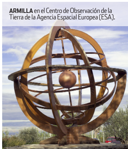
ARMILLA en el Centro de Observación de la Tierra de la Agencia Espacial Europea (ESA).

Ya desde la Antigüedad nos percatamos de que los cuerpos celestes se mueven