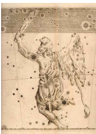
Gravat de la constel·lació d'Orió Uranometria de Johann Bayer, 1603

En la mitologia grega, Orió era un gegant caçador. Un dia se'n va anar a caçar amb la deessa Àrtemis. Unes versions expliquen que Orió va intentar posseir-la. D'altres, que el gegant presumia que podia matar tots els animals i bèsties de la Terra. Fos com fos, la deessa, enfadada amb Orió, li va enviar un escorpí que el va picar al taló i el va matar. Àrtemis, penedida per haver castigat el gegant amb excessiva severitat, va demanar a Zeus que li concedís la immortalitat i l'elevés al cel en forma de constel·lació. Així ho va fer també amb l'escorpí, disposant-los de tal manera que quan un surt l'altre s'amaga, i es van perseguint eternament.